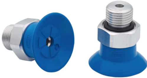
SUF 15 HT1-60 M5-AG

La ventouse SUF (partie en élastomère + raccord) est livrée assemblée.