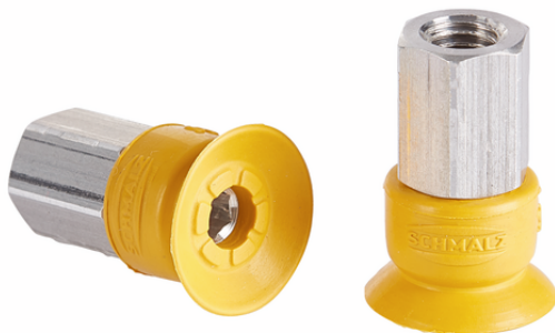
SUF 10 NBR-ESD-55 M5-IG

Der Sauggreifer SUF (Elastomerteil + Anschlussnippel) wird montiert geliefert.