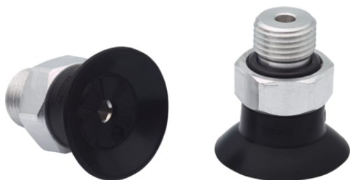
SUF 18 SI-CO-55 G1/8-AG

La ventosa SUF (parte in elastomero + nipplo di connessione) viene fornita montata.