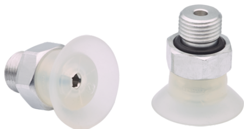
SUF 15 SI-55 G1/8-AG

La ventosa SUF (parte in elastomero + nipplo di connessione) viene fornita montata.