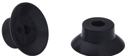
SUF 25 SI-CO-55 SC040