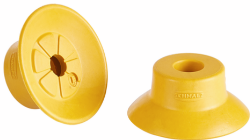
SUF 25 NBR-ESD-55 SC040