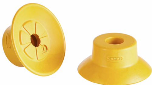
SUF 20 NBR-ESD-55 SC030