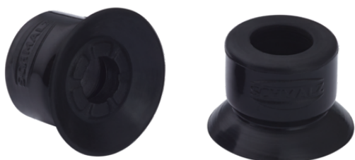
SUF 10 SI-CO-55 SC030