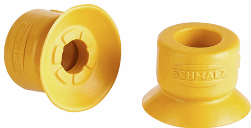
SUF 10 NBR-ESD-55 SC030