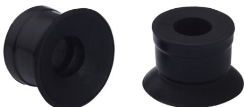
SUF 5 SI-CO-55 SC020