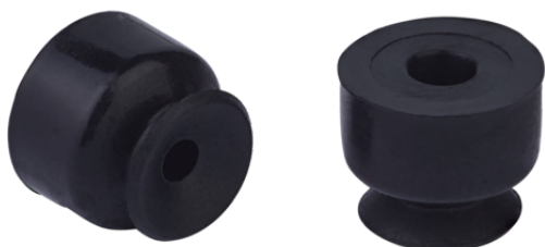
SUF 2 SI-CO-55 SC010