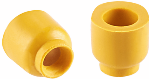
SUF 2 NBR-ESD-55 SC010