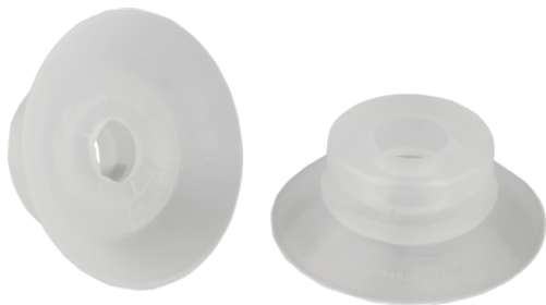
SUF 35 SI-55 SC050