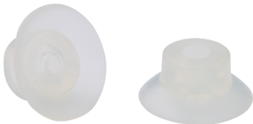
SUF 25 SI-55 SC040