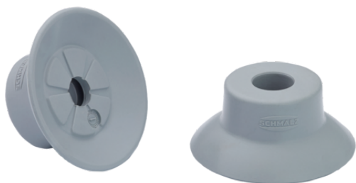
SUF 25 NBR-55 SC040