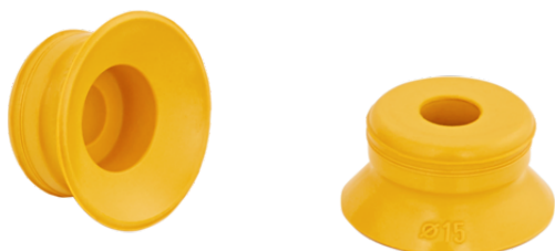
PFG 15 NBR-ESD-55 N005