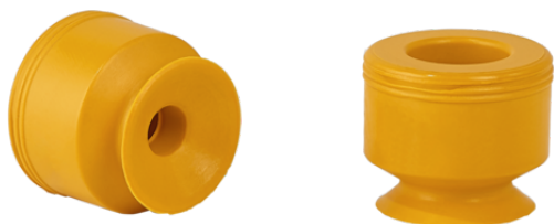
PFG 5 NBR-ESD-55 N004