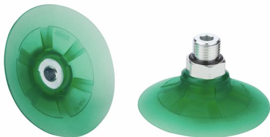
SPF 50 ED-65 G1/4-AG