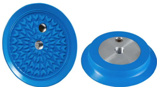
SGF 125 HT1-60 G3/8-IG