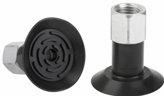
SGPN 34 FPM-65 G1/4-IG