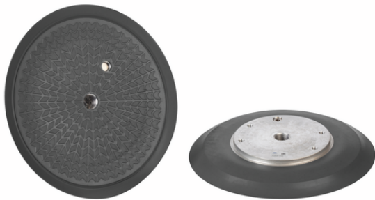
SGF-HS 250 EPDM-55 G1/2-IG