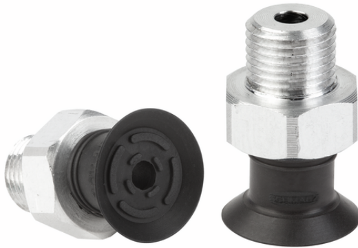
SGPN 15 FPM-65 G1/8-AG

La ventouse SGPN (pièce en élastomère + insert de connexion) est livrée non montée. Contenu de la livraison :