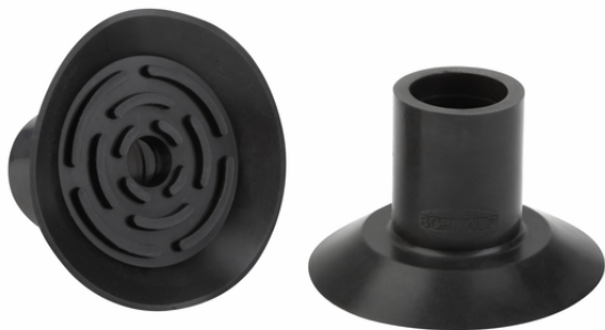
SGP 34 FPM-65 N033