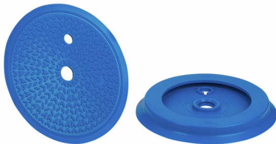
DR-SGF 200 HT1-60