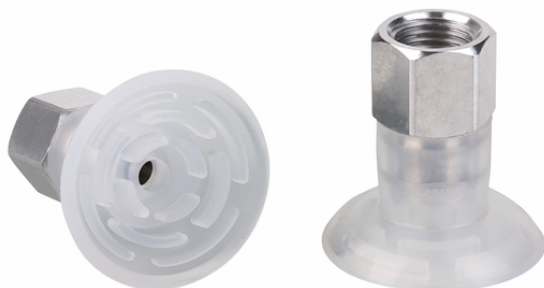
SGPN 35 SI-50 G1/4-IG