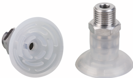
SGPN 35 SI-50 G1/4-AG