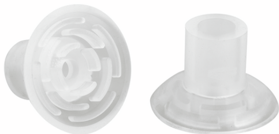
SGP 35 SI-50 N034