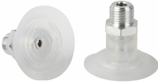
SGPN 40 SI-50 G1/4-AG