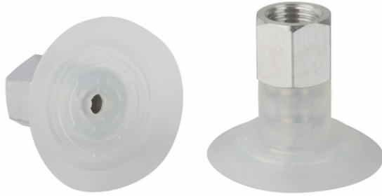
SGPN 40 SI-50 G1/4-IG