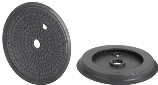
DR-SGF 200 EPDM-55