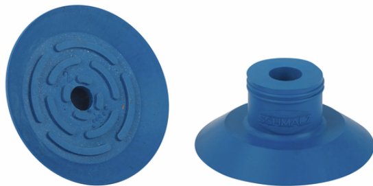
SGP 24 HT1-60 N016