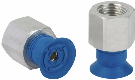
SGPN 15 HT1-60 G1/8-IG

La ventosa SGPN (parte in elastomero + nipplo di connessione) viene fornita non montata. La fornitura è costituita da: