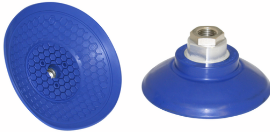
SAG 80 NBR-60 G1/4-IG