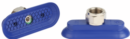
SAOG-S 80x30 NBR-60 G3/8-IG