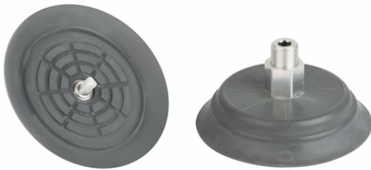
SHFN 70 NK-45 G1/4-AG E TV