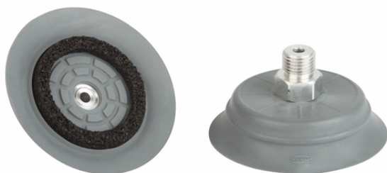
SHFN 70 NK-45 G1/4-AG E MOS