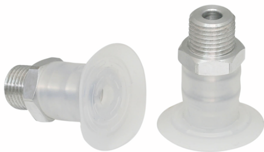
SGPN 30 SI-50 G1/4-AG