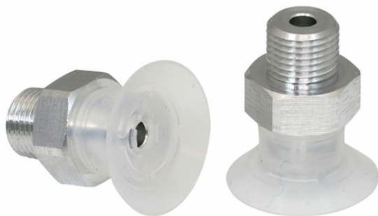
SGPN 20 SI-50 G1/8-AG