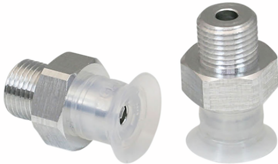
SGPN 15 SI-50 G1/8-AG

真空パッド SGPN: パッドにネジが取り付けられた状態で納品されます。以下の製品で構成されます。