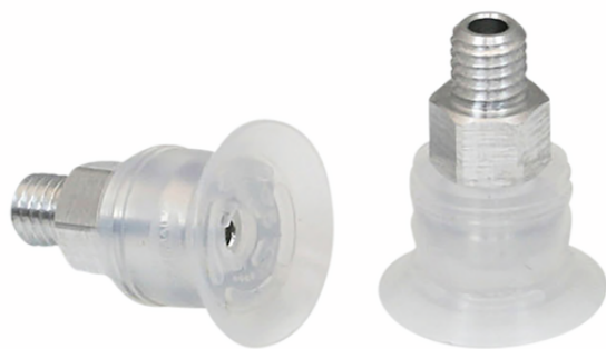
SGPN 15 SI-50 M5-AG