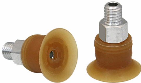
SGPN 15 NK-40 M5-AG