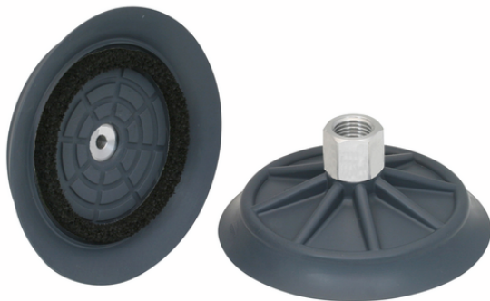
SHFN 85 NK-45 G1/4-IG MOS