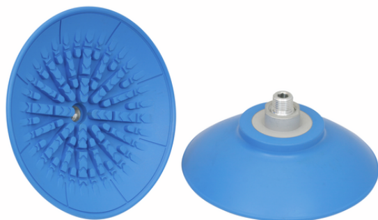
SAF 125 NBR-45 G1/4-AG

La ventouse SAF, disponible en différents diamètres, est livrée avec insert de connexion vulcanisé à la pièce en élastomère.