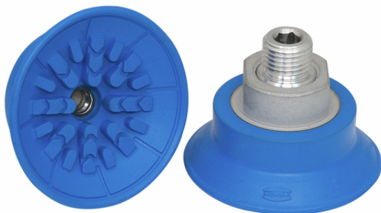
SAF 50 NBR-45 G1/4-AG

La ventosa SAF, disponible en diversos diámetros, se suministra con boquilla de conexión vulcanizada en la pieza elastomérica.