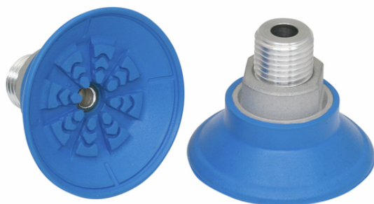
SAF 40 NBR-45 G3/8-AG

La ventouse SAF, disponible en différents diamètres, est livrée avec insert de connexion vulcanisé à la pièce en élastomère.