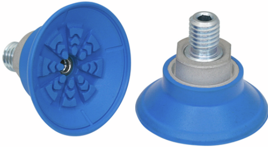
SAF 40 NBR-45 M10-AG

La ventouse SAF, disponible en différents diamètres, est livrée avec insert de connexion vulcanisé à la pièce en élastomère.