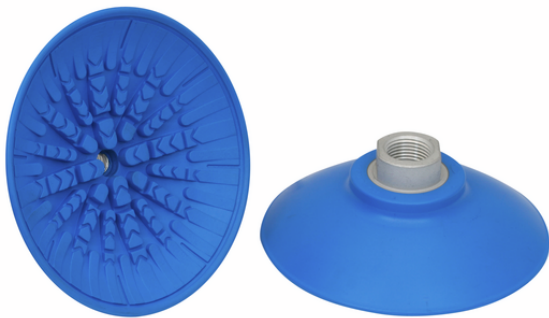
SAF 100 NBR-45 G3/8-IG

La ventosa SAF, disponible en diversos diámetros, se suministra con boquilla de conexión vulcanizada en la pieza elastomérica.