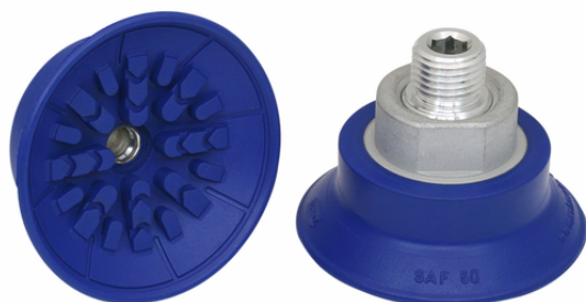
SAF 50 NBR-60 G3/8-AG

La ventosa SAF, disponible en diversos diámetros, se suministra con boquilla de conexión vulcanizada en la pieza elastomérica.