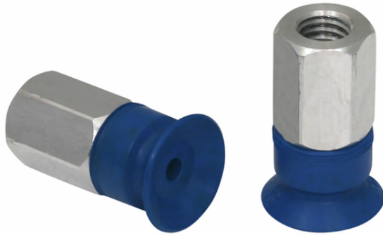
PFYN 10 HT1-60 M5-IG