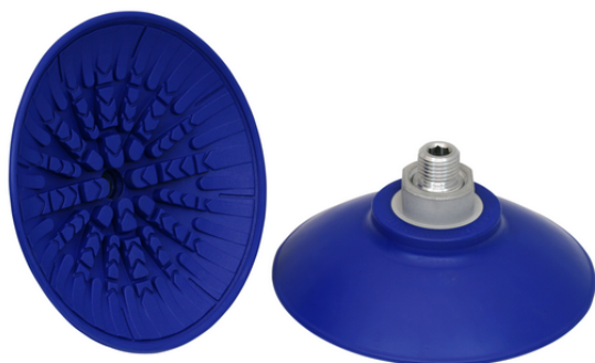
SAF 100 NBR-60 G3/8-AG

真空パッド SAFは、接続ニップル (取付ネジ) が取り付けられた状態で納品されます。様々なサイズのパッドをラインアップしています。